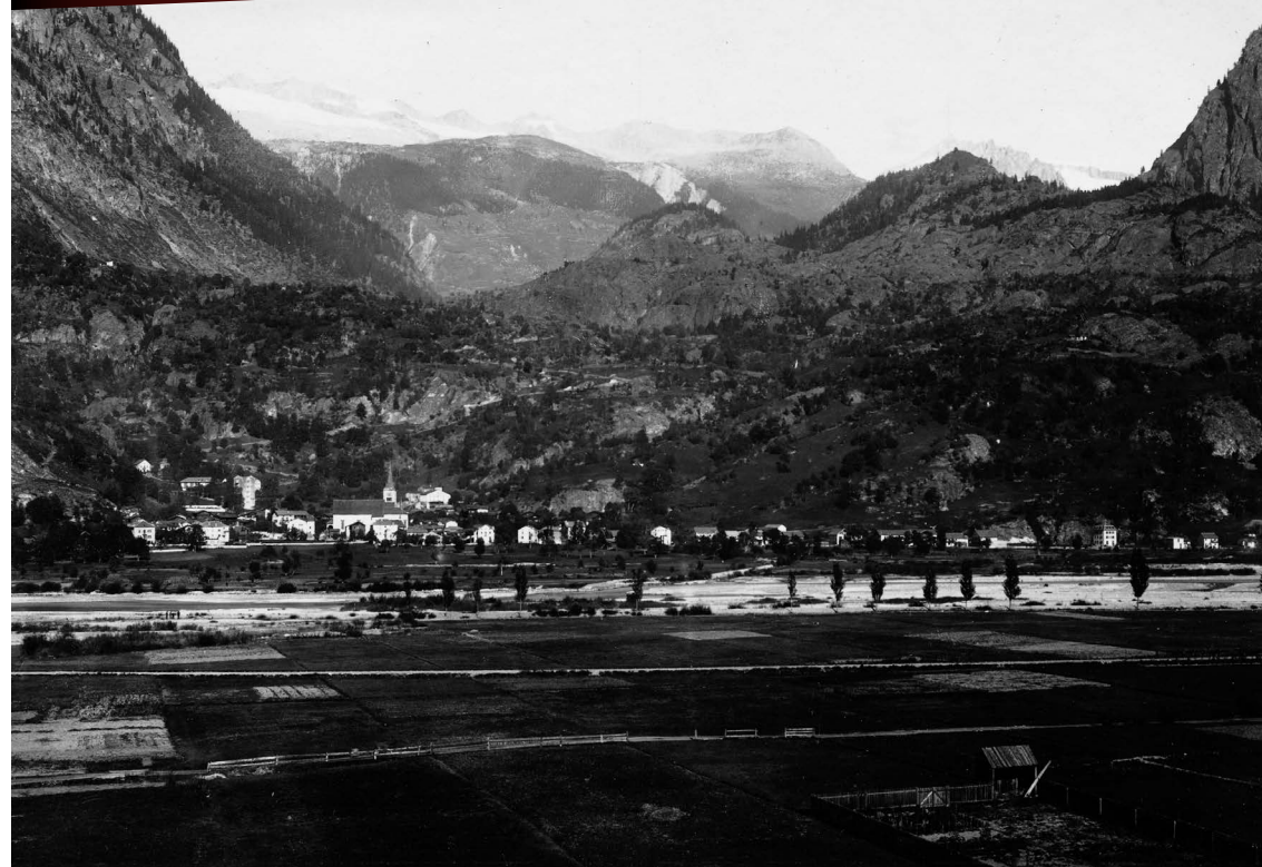
Naters en 1900. La «ville» est alors, avec 3953 habitants, la deuxième du canton en ce qui concerne la population.

Société d'histoire du Valais romand Chemin des Barrières 21 Case postale 854 1920 Martigny