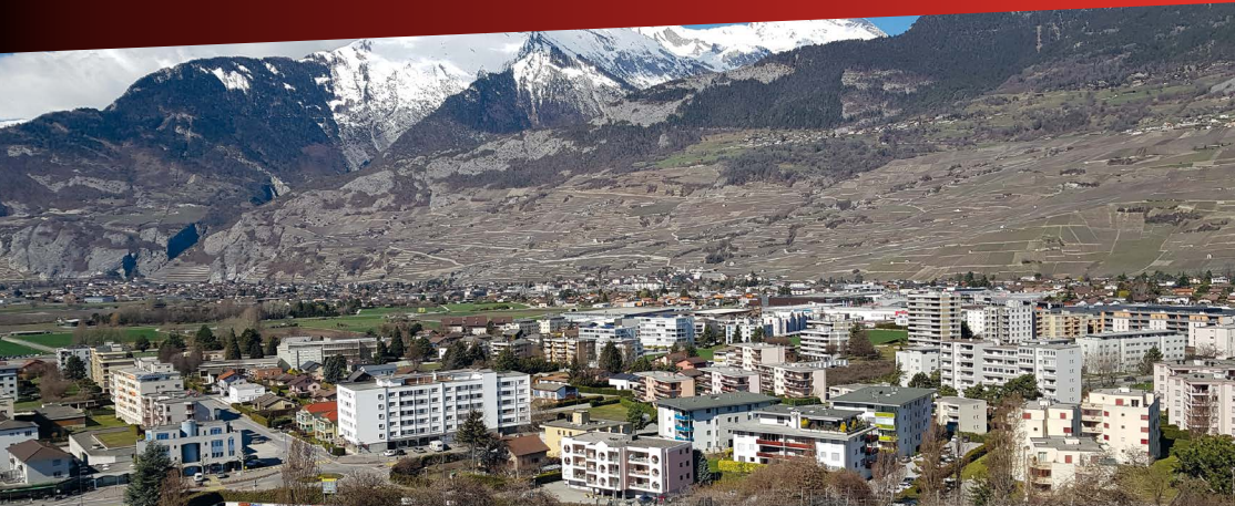
Conthey, de la colline de Châteauneuf, 2015.

Que nous apportent, aujourd'hui, les études historiques et les réflexions sur la connaissance et la gestion d'un territoire? L'exemple de la plaine d'Ardon-Conthey-Vétroz.