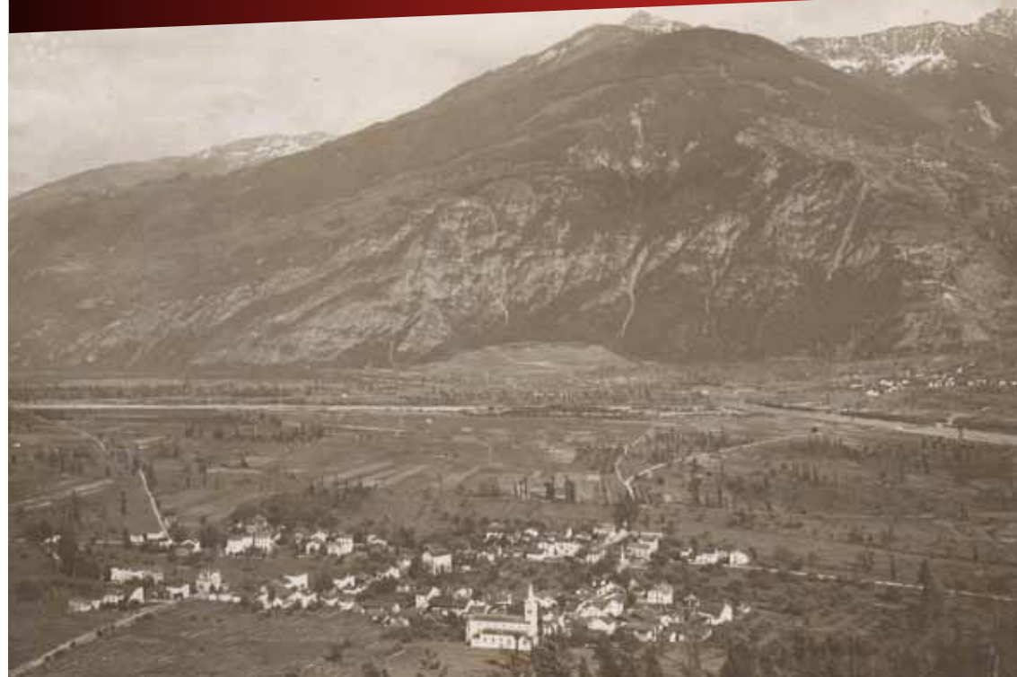
Leytron, vers 1920

Société d'histoire du Valais romand Chemin des Barrières 21 Case postale 854 1920 Martigny